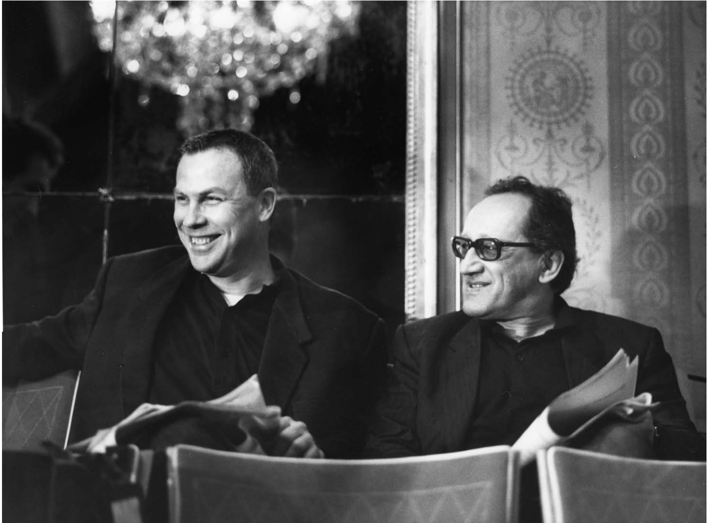
Robert Wilson und Heiner Müller Schlosstheater Ludwigsburg 1987